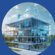
整合 IoT 的 智慧建築